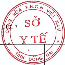
BẢNG PHÂN BỐ ĐỐI TƯỢNG, VẮC XIN COVID-19, VẬT TƯ TIÊM CHỦNG (Đính kèm Kế hoạch số 7227/KH-SYT ngày 30 tháng 8 năm 2021 của Sở Y tế tỉnh Đồng Nai)